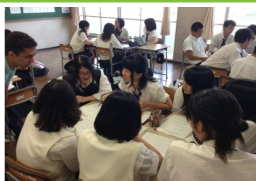
(学校内で実施の様子)

新型コロナウイルスの影響により、様々な学校行事が中止や延期せざるを得ない状況にあります。LbE Japan では、海外研修が中止になっても海外研修と限りなく近い体験を実現します。国内全国(沖縄を除く)へ場所を振り替えての活動はもちろん、どこか特別な場所に行かずに学校内や各教室でもプログラムの実施は可能です。留学生メンバーと一緒にグローバルな体験をしてみませんか。世界の入り口へ、一步踏み出そう！