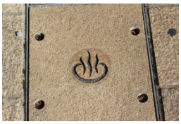
Global Exploration Program in Beppu より出題